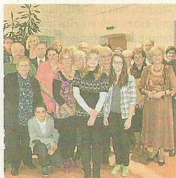
Großes Interesse herrschte beim dritten Kunst- und Literaturabend im Rathaus in St. Paul