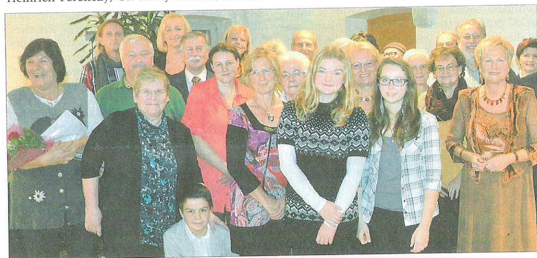
Der 3. St. Pauler Kunst- und Literaturabend fand wieder großen Anklang.

Aufgrund des großen Andrangs wird der Kunst- und Literaturabend am Samstag, dem 7. Dezember, in der Aula der Volksschule Granitztal mit Beginn um 19 Uhr wiederholt!